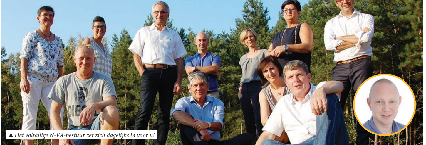
▲ Het voltallige N-VA-bestuur zet zich dagelijks in voor u!

Vanuit de oppositie wist de N-VA de voorbije jaren al heel wat te verwezenlijken voor u. Maar ons werk is nooit af. Daarom vernoemen we graag enkele projecten waar we ook onze schouders onder willen zetten.